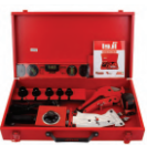
2302 Pipe welding machine set اتو اوله سبک کیفی