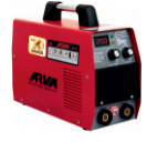
2103 Inverter welding machine دستگاه جوشکاری اینورتر ۲۰۰ آمپر Turbo