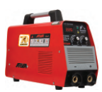
2161 Inverter welding machine دستگاه جوشکاری اینورتر ۲۲۰ آمپر سلولوزی Plus