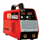
2115 Inverter welding machine دستگاه جوشکاری اینورتر ۲۵۰ آمپر IGBT