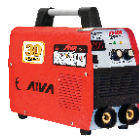
2111 Inverter welding machine دستگاه جوشکاری اینورتر ۲۰۰ آمپر IGBT