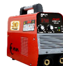
2115 Inverter welding machine دستگاه جوشکاری اینورتر ۲۵۰ آمپر IGBT