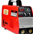
2161 Inverter welding machine دستگاه جوشکاری اینورتر ۲۲۰ آمپر سولوفزی Plus