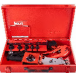
2302 Pipe welding machine set اتو لوله سبز کیفی