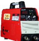
2102 Inverter welding machine دستگاه جوشکاری اینورتر ۲۲۰ آمپر IGBT