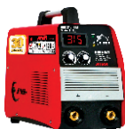
2162 Inverter welding machine دستگاه جوشکاری اینورتر ۳۱۵ آمپر سولوفزی IGBT