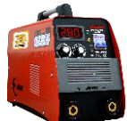
2118 Inverter welding machine دستگاه جوشکاری اینورتر ۲۸۰ آمپر IGBT