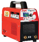
2160 Inverter welding machine دستگاه جوشکاری اینورتر ۲۰۰ آمپر Digital Plus