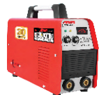
2101 Inverter welding machine دستگاه جوشکاری اینورتر ۲۱۵ آمپر IGBT