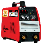
2119 Inverter welding machine دستگاه جوشکاری اینورتر ۳۱۵ آمپر IGBT