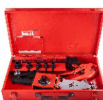
2302 Pipe welding machine set اتو لوله سبز کیفی