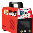
2160 Inverter welding machine دستگاه جوشکاری اینورتر ۲۰۰ آمپر Digital Plus