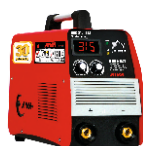
2162 Inverter welding machine دستگاه جوشکاری اینورتر ۳۱۵ آمپر سولنویز IGBT