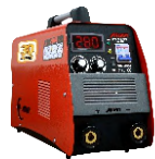
2118 Inverter welding machine دستگاه جوشکاری اینورتر ۲۸۰ آمپر IGBT