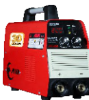
2102 Inverter welding machine دستگاه جوشکاری اینورتر ۲۲۰ آمپر IGBT