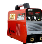
2115 Inverter welding machine دستگاه جوشکاری اینورتر ۲۵۰ آمپر IGBT