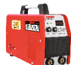
2101 Inverter welding machine دستگاه جوشکاری اینورتر ۲۱۵ آمپر IGBT