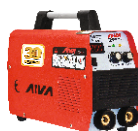
2111 Inverter welding machine دستگاه جوشکاری اینورتر ۲۰۰ آمپر IGBT