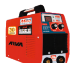
2170 Inverter welding machine دستگاه جوشکاری اینورتر ۲۰۰ آمپر MEGA