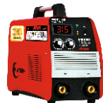
2119 Inverter welding machine دستگاه جوشکاری اینورتر ۳۱۵ آمپر IGBT