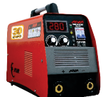
2118 Inverter welding machine دستگاه جوشکاری اینورتر ۲۸۰ آمپر IGBT