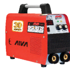
2111 Inverter welding machine دستگاه جوشکاری اینورتر ۲۰۰ آمپر IGBT