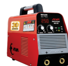
2115 Inverter welding machine دستگاه جوشکاری اینورتر ۲۵۰ آمپر IGBT