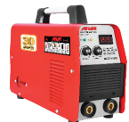
2101 Inverter welding machine دستگاه جوشکاری اینورتر ۲۱۵ آمپر IGBT