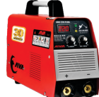
2161 Inverter welding machine دستگاه جوشکاری اینورتر ۲۲۰ آمپر سولوزی Plus