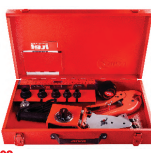
2302 Pipe welding machine set اتو لوله سبز کیفی