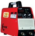
2102 Inverter welding machine دستگاه جوشکاری اینورتر ۲۲۰ آمپر IGBT