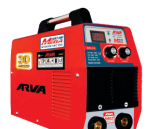
2170 Inverter welding machine دستگاه جوشکاری اینورتر ۲۰۰ MEGA آمپر