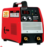
2119 Inverter welding machine دستگاه جوشکاری اینورتر ۳۱۵ آمپر IGBT