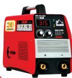
2162 Inverter welding machine دستگاه جوشکاری اینورتر ۳۱۵ آمپر سولوزی IGBT